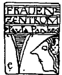
Frauenzentrum Paula Panke e.V.